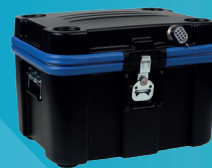
Safety Box