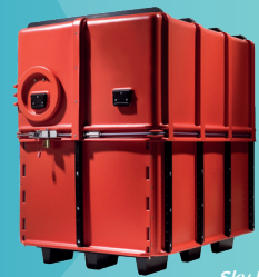
Sky Box

All rights reserved. The information and specifications included are subject to change without prior notice. Sagemcom Energy & Telecom tries to ensure that all information in this document is correct, but does not accept liability for error or omission. Non contractual document. All trademarks are registered by their respective owners. Simplified joint stock company Capital 25 605 811.80 Euros - 518 250 337 RCS Nanterre - SIBR15-01.10.18 Sagemcom Dr. Neuhaus GmbH 01/2020, Dok.-Nr.: 8209AQ012 Rev. 1.2