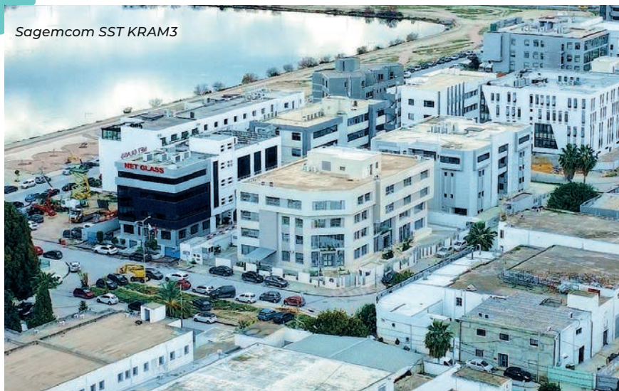
Sagemcom SST KRAM3

La stratégie de croissance de notre Groupe s'est accompagnée d'une augmentation significative des investissements en R&D : moyens, outils, ressources humaines, locaux, etc. Dans ce cadre, nos centres R&D ont fait l'objet de création d'extensions. En Tunisie, l'ouverture de nouveaux bureaux permettent d'améliorer les conditions de travail de tous les collaborateurs (élargissement de l'espace de travail, création de nouveaux laboratoires, etc.).